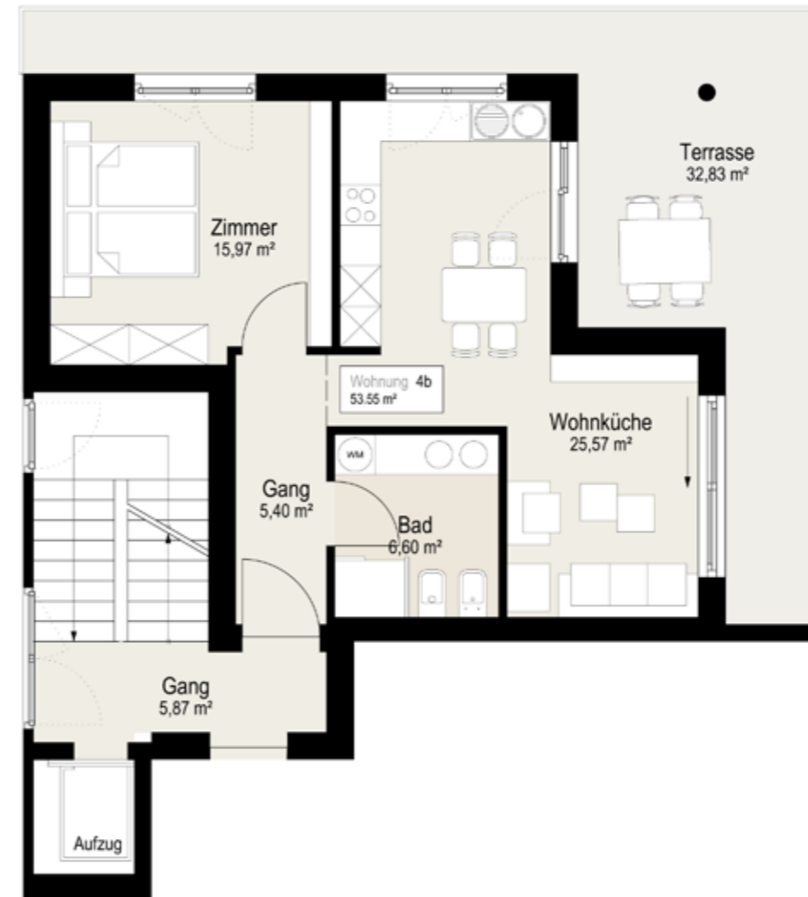
GRUNDRISS / PLANIMETRIA