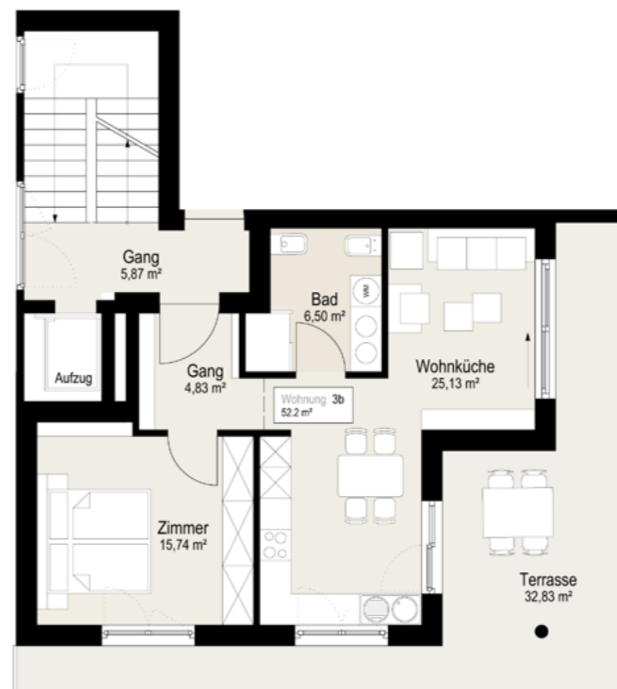
GRUNDRISS / PLANIMETRIA