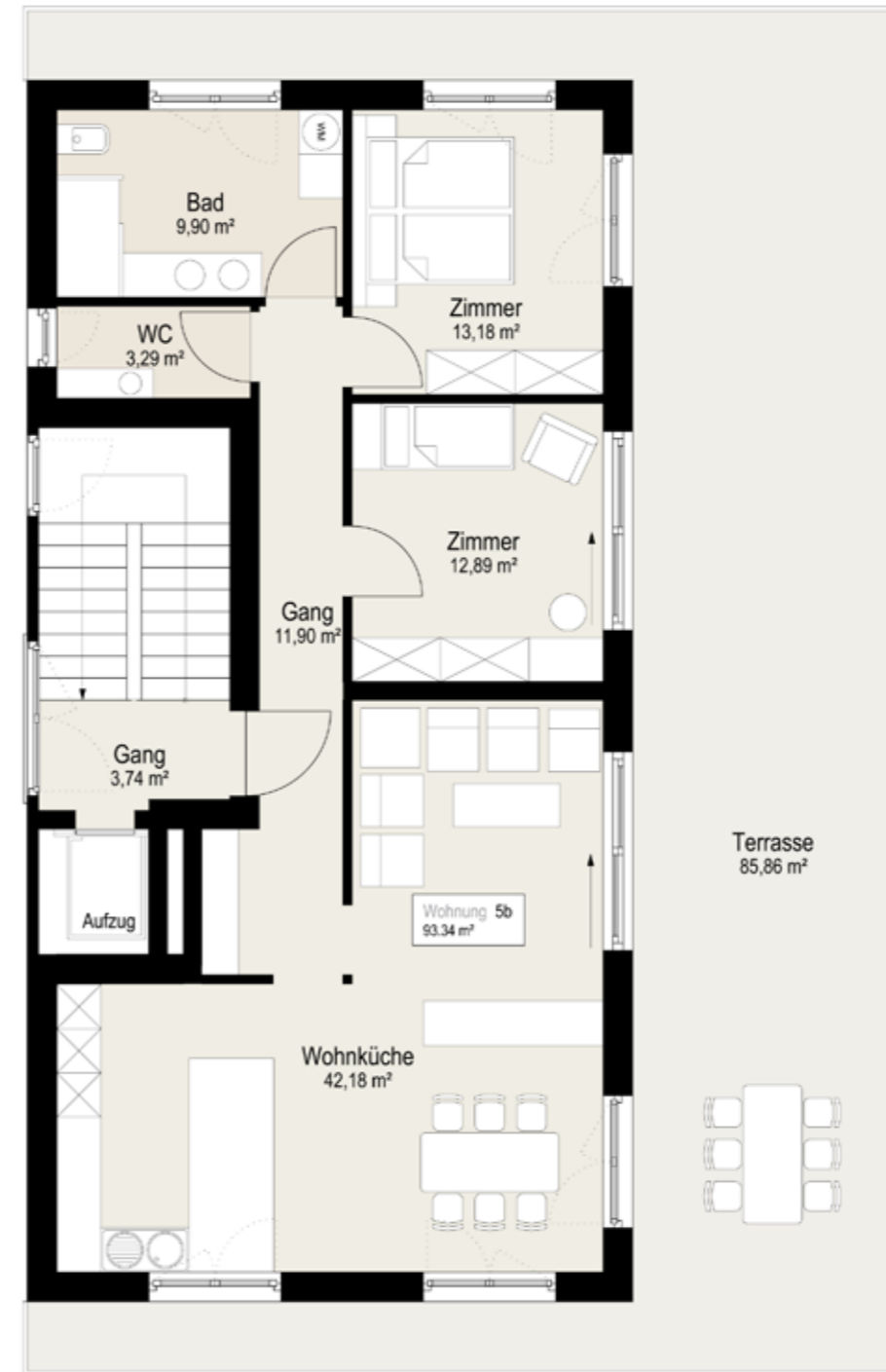
GRUNDRISS / PLANIMETRIA